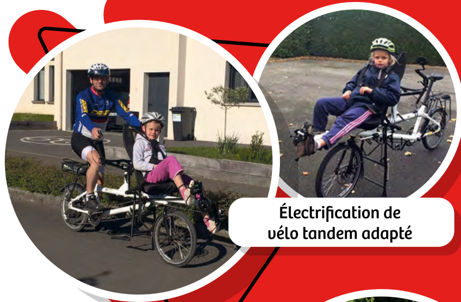
Électrification de vélo tandem adapté